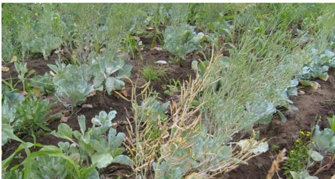
Figure 2. Produção da semente de couve Tronchuda Portuguesa generalment associada a elevada incidência da podridão negra em Moçambique