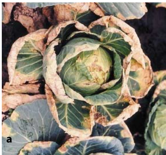
Figure 6a. Necroses foliares em forma de V