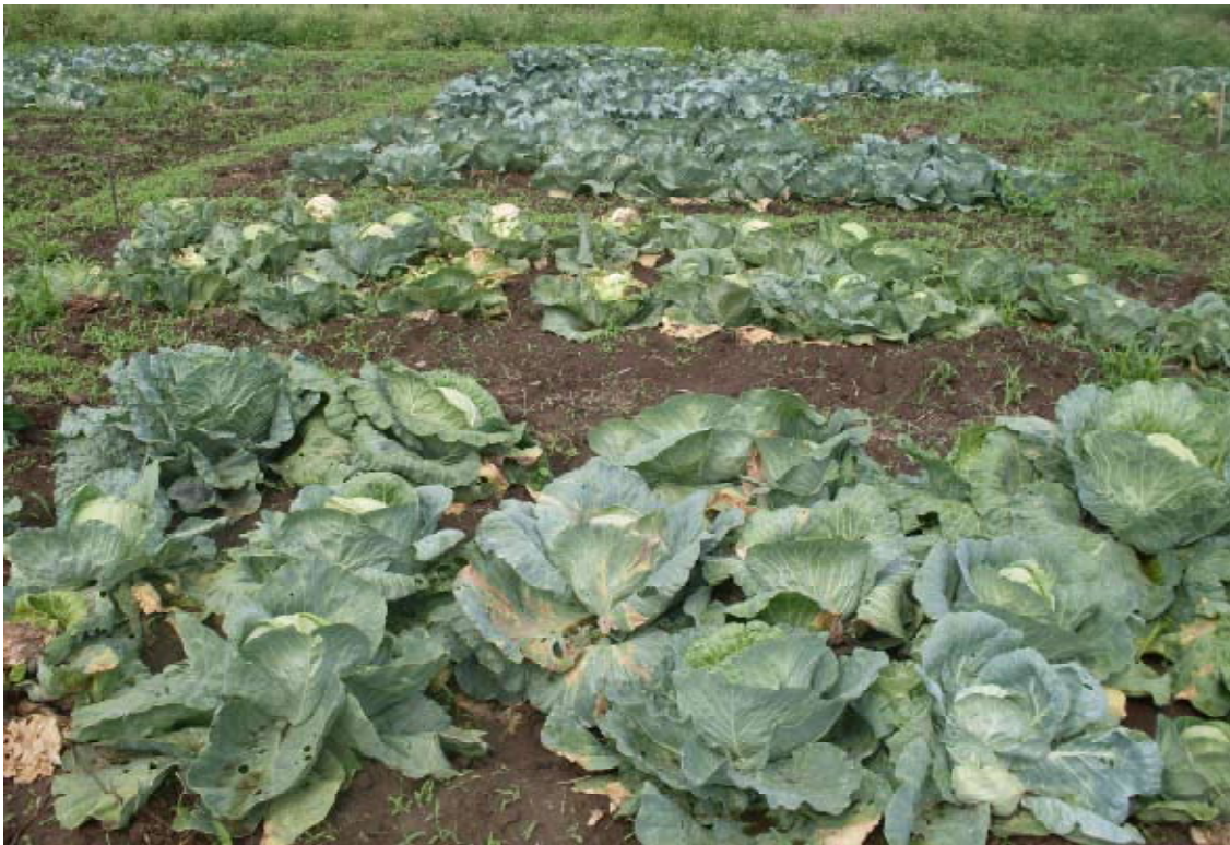
Figure 11. Ensaio de campo mostrando variabilidade das diferentes variedades no concernente a tolerância a podridão negra das Brassicas.

O uso de variedades resistentes ou tolerantes a PNC, onde quer que estejam comercialmente disponíveis, foi desde sempre reconhecido como sendo uma boa estratégia de manejo da doença. Levantamentos de campo acompanhados de inquéritos aos agricultores, constataram que as variedades normalmente produzidas pelos agricultores são: Copenhagen market, Gloria F1, Gloria of Enkhuizen, Star 3308, Star 3317, Drumhead, Tropicana e Conquistador. Para melhor recomendar aos produtores estas variedades foram submetidas aos ensaios de campo na Estação Agrária de Chókwè em duas épocas consecutivas. Importa lembrar que a doença é favorecida por períodos quentes e chuvosos. De salientar que na época fresca e seca (de Março – Agosto) os agricultores não correm muitos riscos de perdas devido a doença, independentemente das suas opções em termos de variedade. Contudo na época chuvosa e quente as variedades Conquistador, Tropicana e Star 3308 demonstraram ser relativamente tolerantes em relação às outras (Fig. 11).