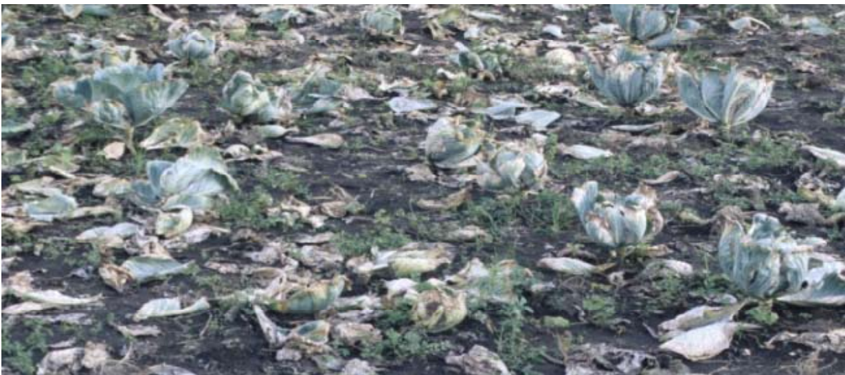
Figure 1. Perdas na ordem dos 100% devido a podridão negra em Boane

A produção de semente nos trópicos esta geralmente associada a elevada incidência, sendo a semente a fonte de inoculo primário. Semente contaminada e ou infectada pela doença é uma das mais importantes fontes de inoculo. Com efeito, apenas uma semente infectada num universo de 10, 000 sementes testadas num lote, é considerado um limiar aceitável, mas tolerância zero deve ser observada na produção de repolho a partir de viveiro (Schaad, 1982; ISTA, 2007).