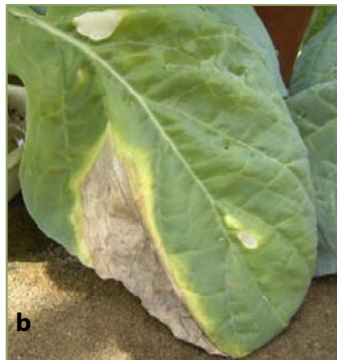
Figure 6b. Colapso do tecido internerval em repolho

No campo, a infecção pela Xcc causa lesões foliares cloróticas a necróticas começando a partir das margens em em forma de V com o vértice voltado para a base da folha (Fig. 6a & b), descoloração vascular preta a castanha (Fig. 7), paralisação do crescimento.