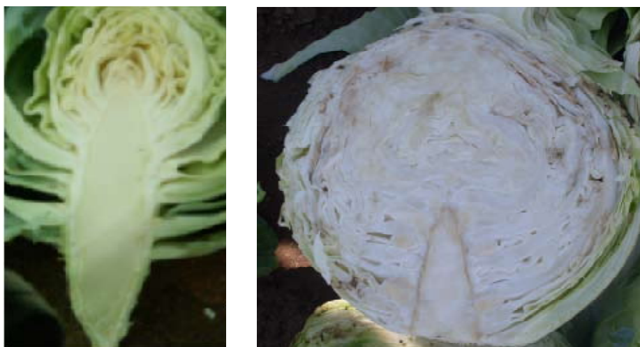
Figure 7. Sintomas sistêmicos da podridão negra: planta saudável (esquerda); decoloração castanha (ou preta) no caule do repolho que se estende em algumas folhas internas (direita)

A descoloração preta dos tecidos vasculares da o nome comum a doença “Podridão negra”. Com o avanço do patogeno das margens foliares para as nervuras, cloroses e colapso necrotico do tecido internerval (Fig. 7b), desenvolve-se como resultado do bloqueio dos vasos condutores por exopolissacarídeos bacterianos e pelos componentes da parede celular degradada. Lesões criadas pelo ataque de Xcc podem servir como porta de entrada para outros saprófitos ou parasitas facultativos, tais como Pectobacterium carotovorum subsp. carotovorum (Syn. Erwinia carotovora pv. carotovora ) (Fig. 8).