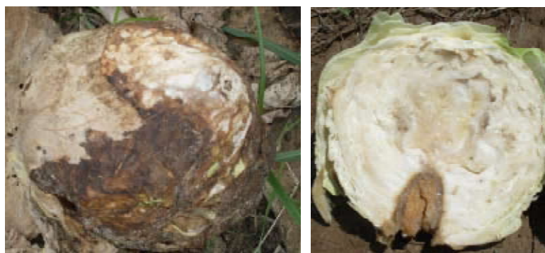
Figure 8. Sintomas da podridão mole causada por Pectobacterium carotovorum subsp. carotovorum