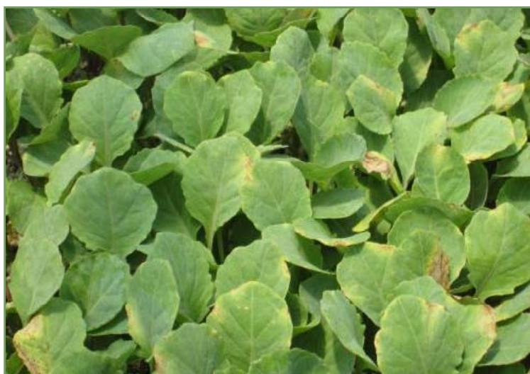
Figure 5. Cloroses e necroses foliares no viveiro de repolho