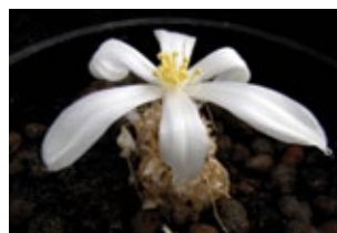
Gethyllis / Apodolirion 38 arter