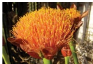
Scadoxus 9 arter