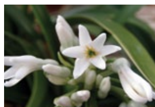
Clivia 4 arter