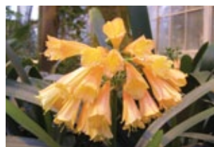
Cryptostephanus 3 arter