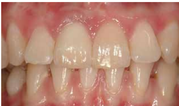
Fig. 2. En patient har mistet 11, og begge nabo-tænder er intakte. Erstatning med en implantat-understøttet enkelttandskrone regio 11 er førstevalget.

Fig. 2. A patient has lost 11 and both adjacent teeth are intact. Replacement with an implant-supported crown region 11 is the first treatment option.