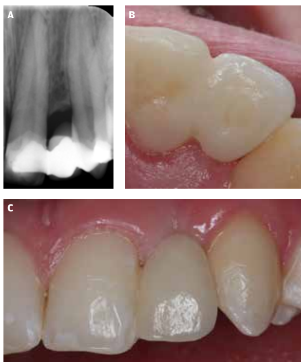
Fig. 1. A. En løs ætsbro i regio 22 med insufficient knoglevolumen for implantatindsættelse. B og C. En 2-leads keramisk (lithium-disilikat) ætsbro som erstatning for 22 med 12 som bropille set palatinalt ( B ) og facialt fra ( C ).