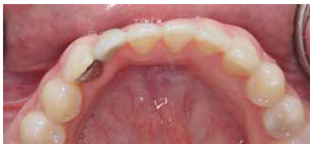
Fig. 3. Ætsbro med en vinge i CoCr erstattende 42.

Fig. 3. Resin-bonded 2-unit bridge in CoCr replacing 42.