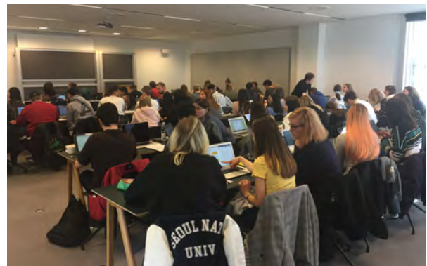
Billede 1: Gruppearbejde i videnskabsteori

De studerende har mulighed for tilvalg på både BA og KA, og vi anbefaler, at de bruger tilvalget til at tone deres uddannelse i forhold til en af vores tematisk-disciplinære søjler og/eller i forhold til et fokuseret karriereperspektiv. Tilvalgsmulighederne er fremragende, både på KU og på andre universiteter i regionen. Mange studerende vælger også tilvalg på internationale universiteter, ikke mindst i Kina og Taiwan. Hertil kommer muligheder for praktik, hvor mange vælger praktik i Kina, fx på de danske repræsentationer.