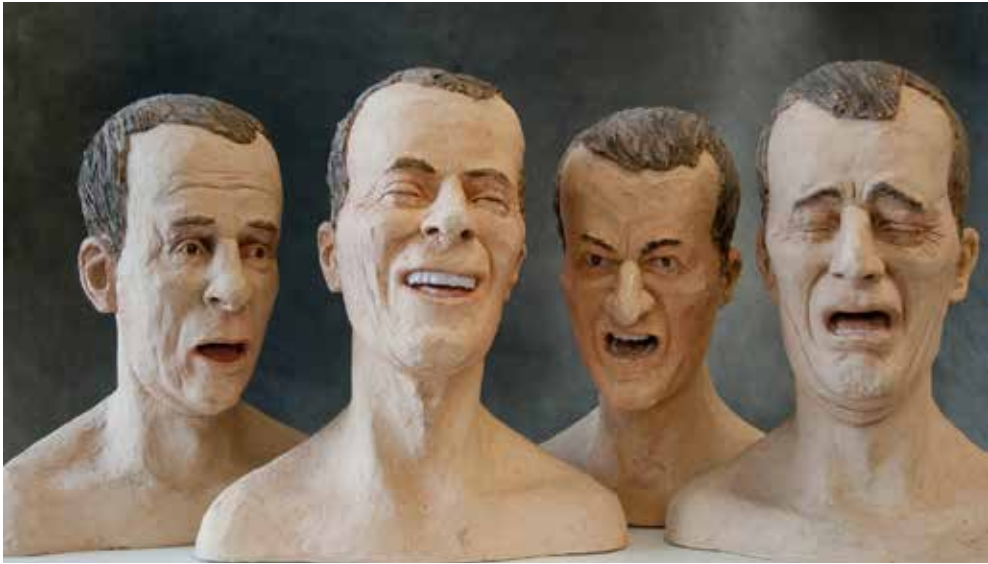
Portrait of a Man 2004–2006 (keramik og pigment) af Gert Germeraad. Foto: Gert Germeraad.

res (delvise) relevans i studiet af følelser. Disse dikotomier blev indskrevet i det følelshistoriske begrebsapparat med den franske Lucien Febvres manifest La Sensibilité et l'Histoire fra 1941.