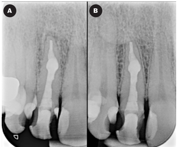
Fig. 4. Postoperativt billede af behandling af 2+ (A). Syv måneders kontrolbillede af 2+ med gendannet lamina dura apikalt (B).