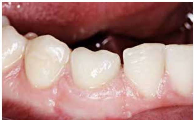
Fig. 10. Implantat-understøttet krone fremstillet i polykrystallinsk zirconia påbrændt dækporcelæn og cementeret til et Atlantis™ abutment.