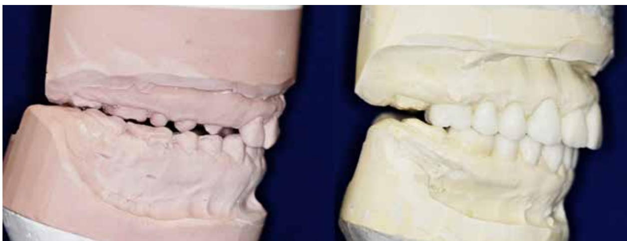
Fig. 3. Bidhøjden øges med 4 mm illustreret med en voksopmodellering af det ønskede resultat. Fig. 3. The vertical occlusal dimension is increased by 4 mm.