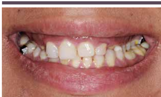
Fig. 1. Tandsæt med amelogenesis imperfecta (hypoplastiske type) behandlet med plastrestaureeringer i børnetandplejen.