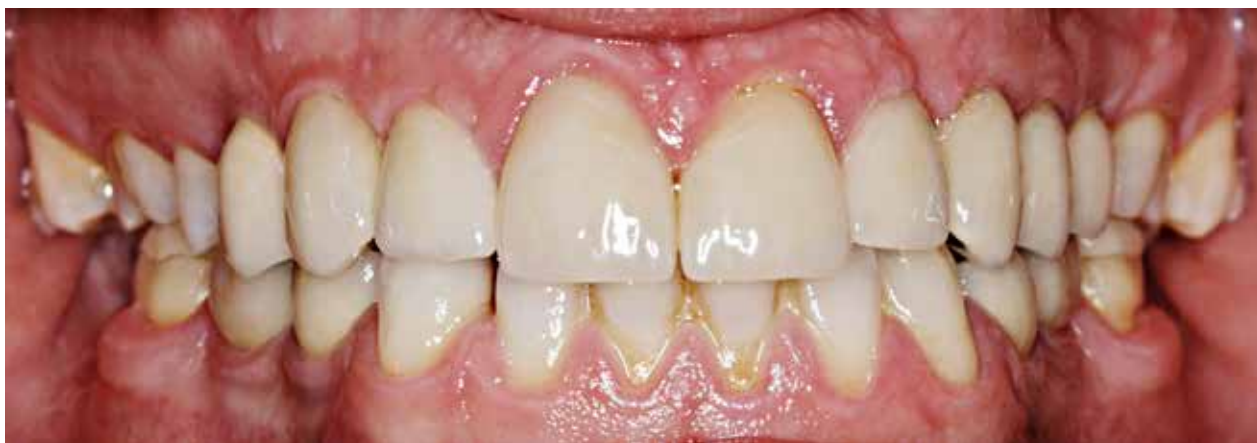
Fig. 7. Implantatunderstøttede broer 14, 13, 12; 22, 23, 24, 25 og kroner 34, 35; 44, 45 er porcelæn veneered Co-Cr, mens kronerne 11 og 21 er lithium-disilikat (IPS e.max® Press, Ivoclar Vivadent, Liechtenstein). On-lays på 36 og 46 er fremstillet i monolitisk traditionel zirconia (NexxZr™, Sagemax, USA).