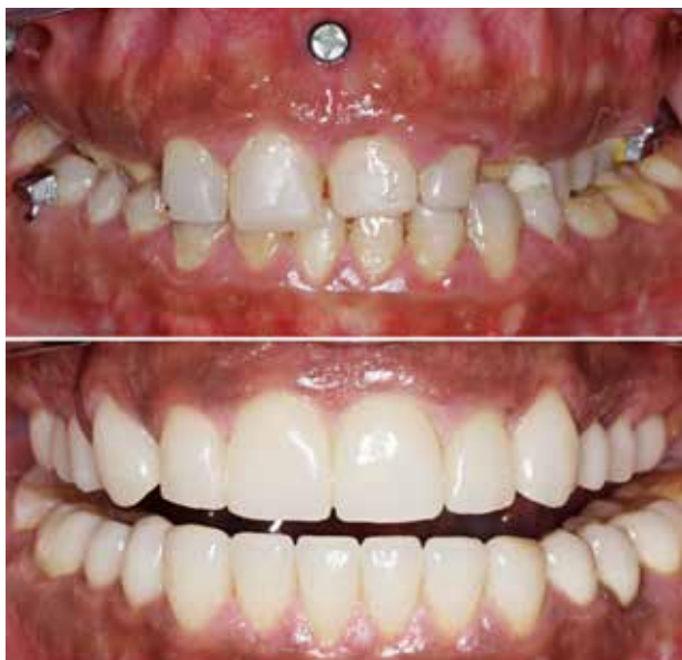
Fig. 4. Før (øverst) og efter (nederst) oral rehabilitering med lithiumdisilicat-baserede kroner (IPS e.max® Press) cementeret med adhæsiv (Multilink®) cement.