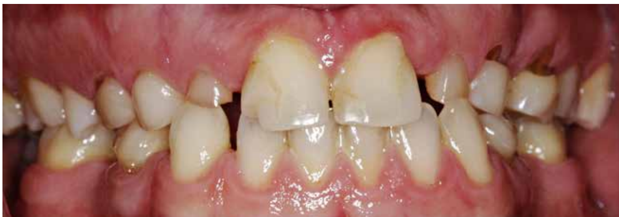
Fig. 5. En 25-årig dreng med agenesi af 15, 13, 12, 22, 23, 24, 25; 37, 35, 34, 44, 45, 47.