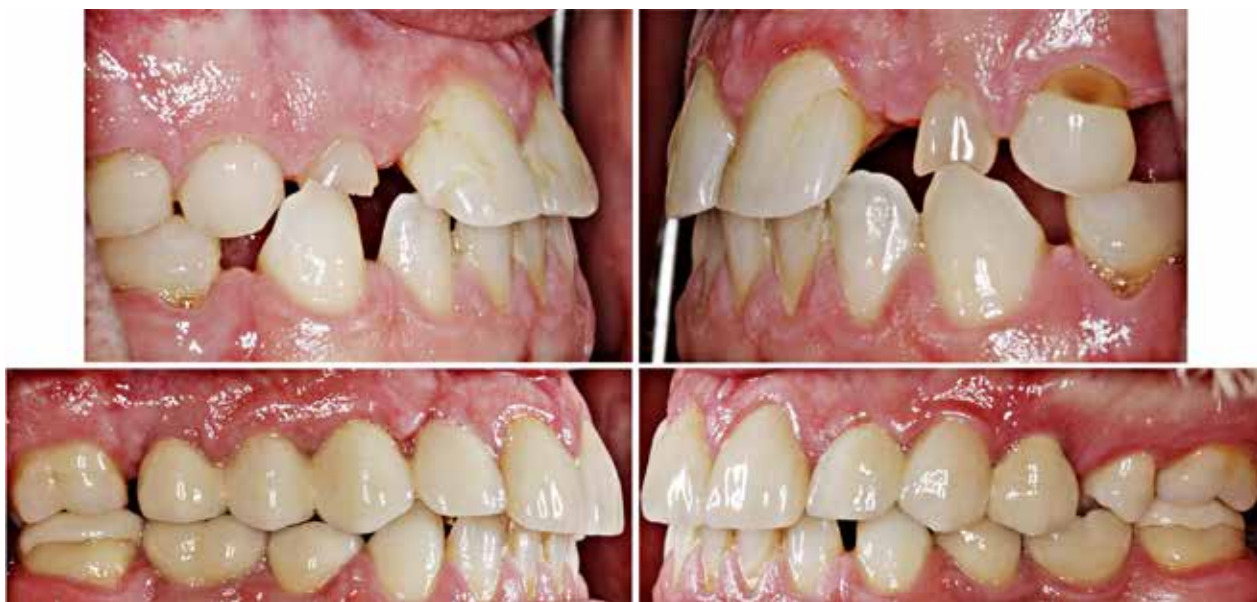
Fig. 8. Svarende til Fig. 7, men set fra siden før (øverst) og efter behandling (nederst) med de tandfarvede kroner og broer.