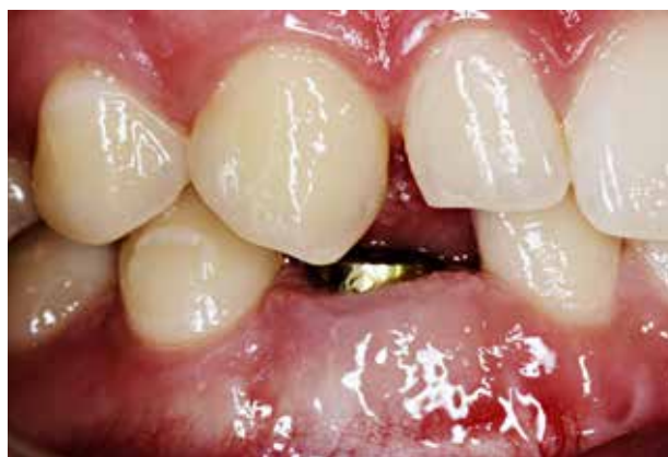
Fig. 9. Hypodonti og let overeruption af antagonist med reducerede pladsforhold for kronefremstilling regio 43.