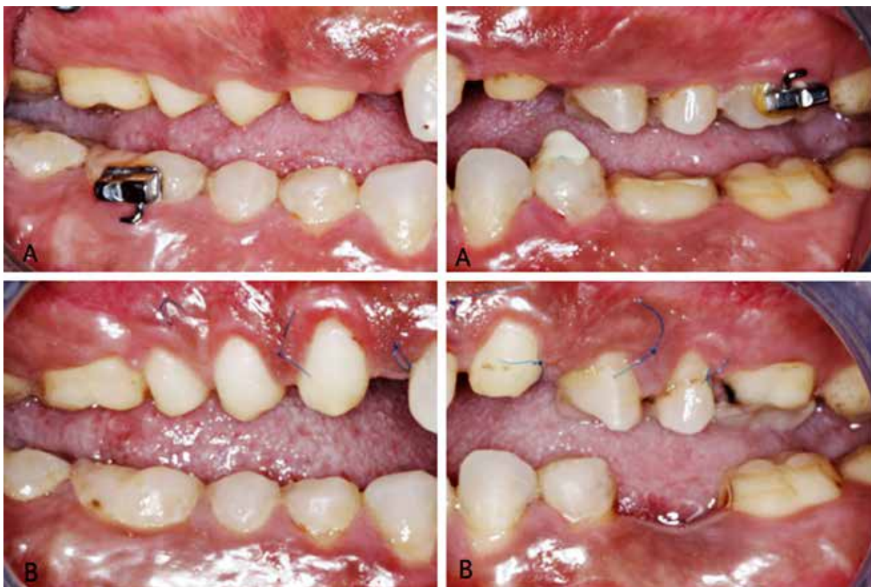
Fig. 2. Kronestubforlængende kirurgi foretages af overkæbetænder. Fig. 2. Crown lengthening surgery in the upper jaw.