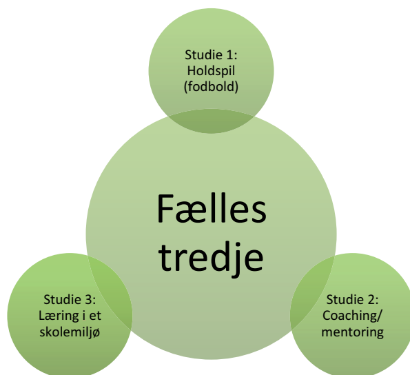
Figur 2. Illustration af de tre særskilt studier, som samlet dannede et fælles tredje for deltagerne.