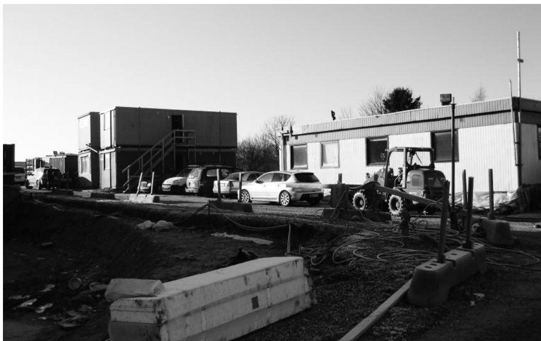
For ikke at komme i karambolage med eksisterende fagdefinitioner er de polske folks arbejdsopgaver defineret som forefaldende opgaver, så som at holde byggepladsen i orden og rydde op. Her afdækkes isoleringsmateriale med plast.

Charek, der i det følgende repræsenterer de to forskellige udgaver af, hvad 'polskhed' kan indebære i forhold til organiseringen af deres hverdagspraksis.