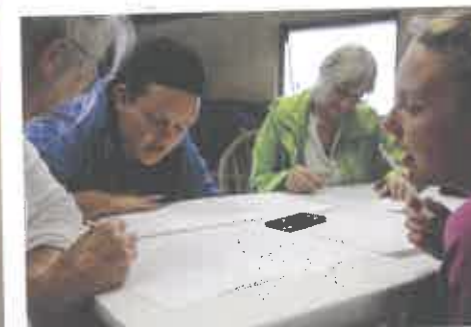
Breakfast Club inviterede over 10 dage til eftermiddagsaktioner og performances hver dag i Bisserup.