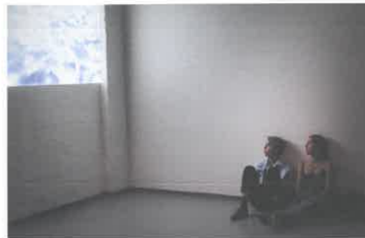
Fra DANSEateliers Performance Feast.