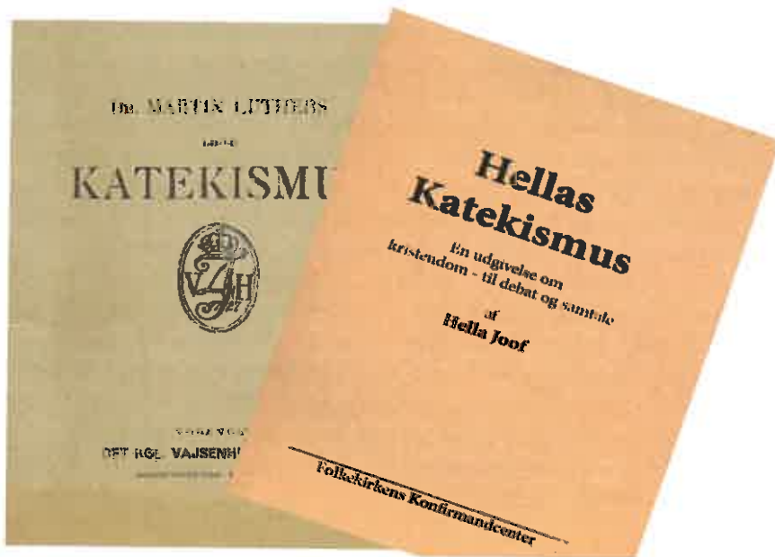
Luthers lille Katekismus og den nye Katekismus ved Hella Joof