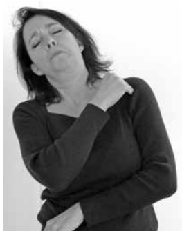
VÆKKE udført med hånden på venstre skulder (referentperspektiv hos patienten).

Også mimik der udtrykker følelser, har børnene svært ved at administrere. P7;4 spærrer øjnene op (bøllens referentperspektiv) da hun beskriver den lille mand nærme sig i Bøllen , men hun har samtidig øjenkontakt med modtageren (fortællerperspektiv), og den kombination betyder efter de voksnes sprognorm at det var fortælleren der blev overrasket.