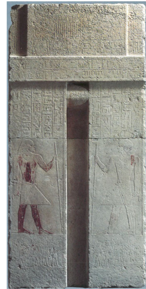
Fig. 4: Deler av Kaemremets kapell i Sakkara, kjøpt via den egyptiske antikvitetsjenersten i 1911, som i dag kan sees på Glyptoteket (inv. nr. ÆIN 1271).

Vestlige arkeologer og egyptologer var i stor grad involvert i handelen, hvilket også er nærmest utenkelig for fagfolk i dag. En av de mest berømte var Howard Carter, mannen som i 1922 fant Tutankhamuns grav i Kongenes Dal: han hadde da i flere år kjøpt og solgt antikviteter for å supplere sin inntekt. Han var blant annet mellommann da Metropolitan Museum of Art i New York kjøpte en berømt gullskatt fra en annen kongelig grav ved Theben, og her tilsvarte hans faste kommisjon på 15% nesten 8000 pund – en betraktelig sum penger i 1920 (det tilsvarer ca. 3 millioner danske kroner i dag). Selv den egyptiske arkeologens far, Sir Flinders Petrie, som ellers er kjent som en forsker forut for sin tid, var meget aktiv på antikvitetsmarkedet. De færreste akademikere