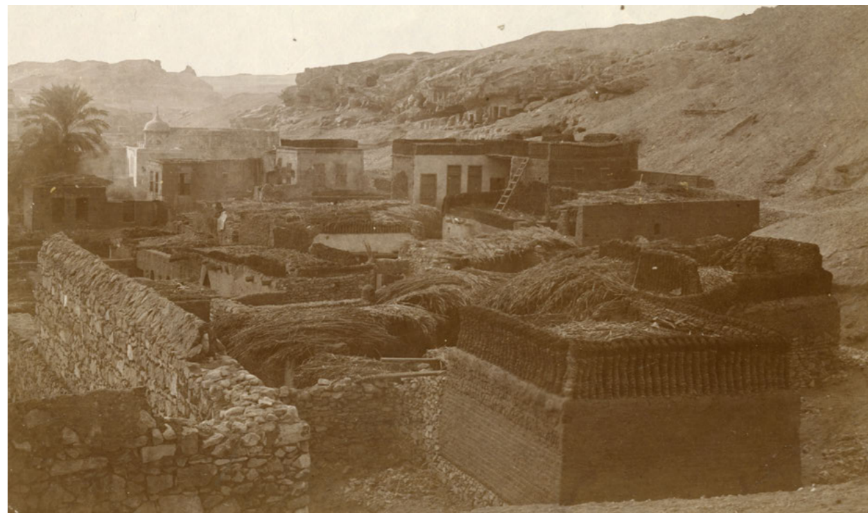
Fig. 3: Bilde av landsbyen Kafr el-Haram, 1899