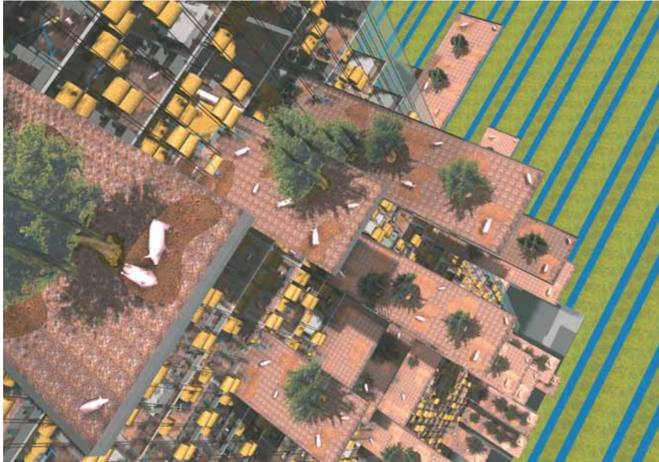
MVRDV's Pig City (2000-2001) sigtede efter at samle hele den hollandske svinebestand (15,2 millioner svin i 1999) i nogle få koncentrerede, tårn-lignende megastrukturer ud fra kvantitative undersøgelses- og programmeringsmetoder, tilsyneladende fritaget fra æstetiske og etiske overvejelser. Perspektiv af de forskudte etageplan i det til svineproduktion byggede højhus.