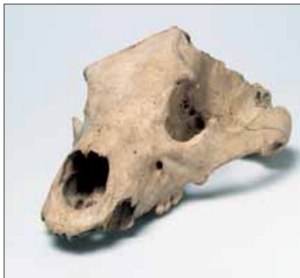
Fig. 3. Kranium af stor bjørn fra Kainsbakke.

faktum at der i det meget omfattende knoglemateriale fra Kainsbakke-pladsen er påvist en række dyrearter der på det pågældende tidspunkt for længst har været uddyddet af mennesket på de danske øer. I Jylland udgøres deres yngste forekomst af fundene fra netop Kainsbakke-pladsen. Dette gælder de store pattedyr vildhest, elg og brunbjørn.