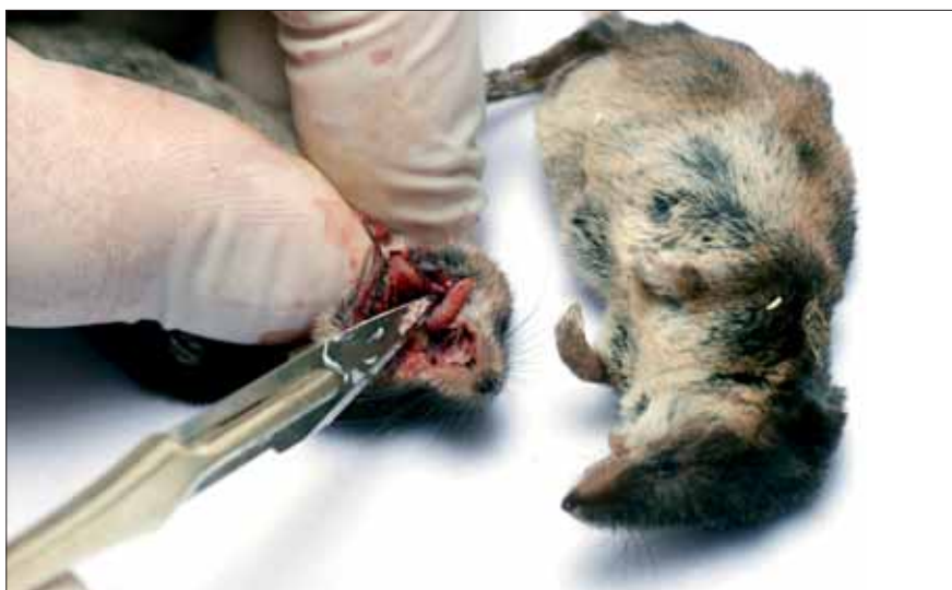
Fig. 2. Musetænder udtages med henblik på måling af strontiumisotopforhold.

Med henblik på den overordnede problemstilling, kontakterne henover Kattegat og deres betydning for den grubekeramiske kulturs frem-