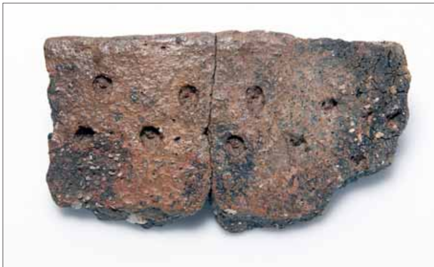
Fig. 1. Grubekeramisk randskår med navngivende dekoration fra bopladsen Højvang 1 ved Randers Fjord.

studier af det arkæologiske materiale som flint, keramik mv. De naturvidenskabelige undersøgelser spænder bredt og berører alt lige fra botaniske makrofossiler over studier af keramikteknologien til omfattende kulstof 14-dateringer af knoglerne. Sidstnævnte er i gang med at blive underkastet en klassisk osteologisk undersøgelse der blandt andet involverer artsbestemmelse og optælling af individer. Disse undersøgelser bliver desuden suppleret med aDNA-analyser (ancient DNA) af menneske- og dyreknogeterne samt af omfangsrige analyser af de stabile isotoper fra kulstof, kvælstof og ilt.