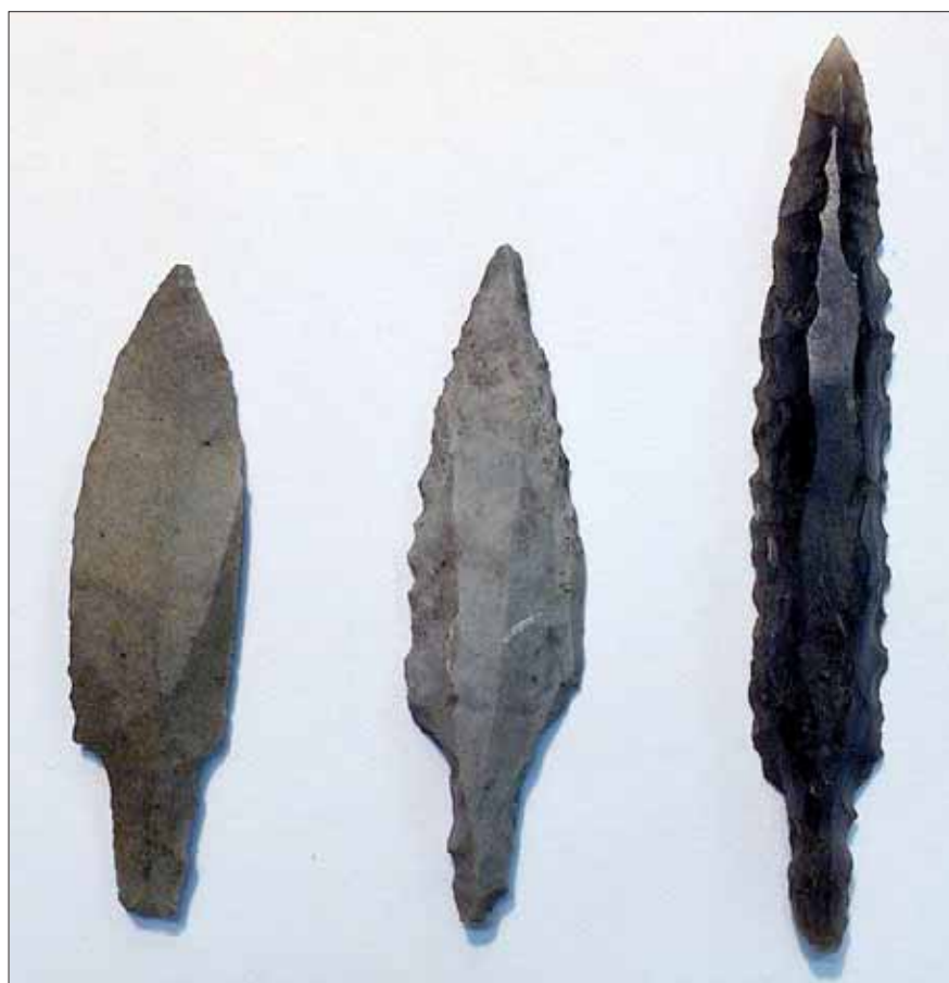
Fig. 4. Type A-, B- og C-skafttungepile ifølge C. J. Beckers typologi.

Med en analogi til jernalderens og vikingetidens opdeling i brede og "skærende" jagtpilespidser på den ene side og lange, slanke og "gennemborende" krigspile på den anden fremsættes den hypotese at en