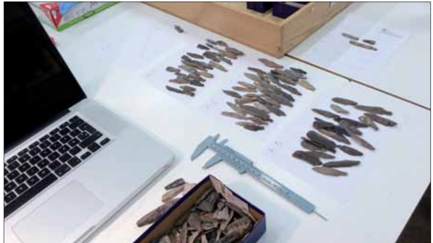
Fig. 7. Registrering af pilespidser på Historiska Museet i Stockholm.

I det forudgående har det kun været muligt at skitsere nogle af de problemstillinger der bliver behandlet under CONTACT-projektet, men der er ingen tvivl om at der vil komme mange nye og spændende resultater i løbet af 2016 og 2017 fra de forskellige delprojekter. Disse resultater, der både indeholder arkæologiske og naturvidenskabelige analyser, bliver løbende publiceret i forskellige fagtidsskrifter. Når alle resultaterne