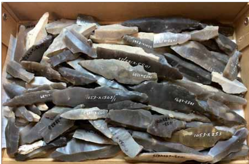
Fig. 5. Kasse med skaftungepile klar til registrering på Museum Østjylland.

lignende opdeling i flintpilematerialet kunne være gældende. For at få statistiske data til rådighed for at sandsynliggøre denne funktionsop-