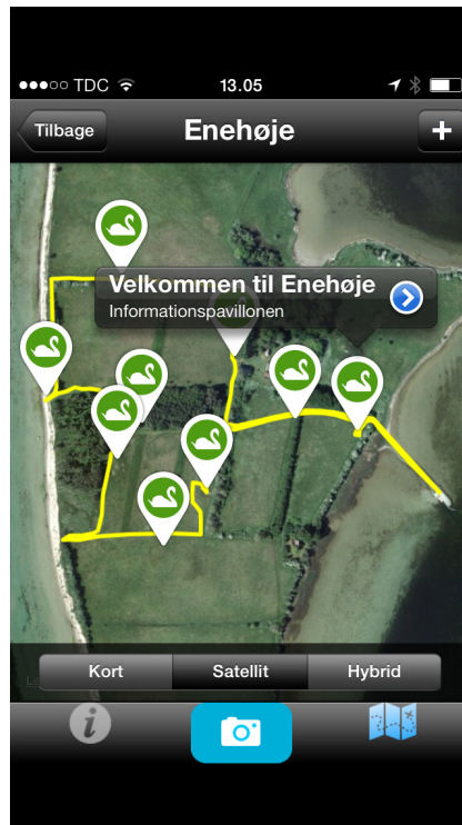
Lolland Kommunes applikation, ”Det naturlige Lolland”, er et eksempel på klassisk formidling af ruter og oplevelsespunkter langs ruterne.

Inddragelse/deltagelse udskilles her som en særlig form for interaktion. Under ”interaktion” ovenfor blev der fokuseret på en bruger-brugerinteraktion. Her tænkes specifikt på tilbagemeldinger fra bruger til udbyder, se figur 1c. Der er eksempler på, at brugerregistreringerne kan indgå som dataregistreringer, som senere kan anvendes og bearbejdes af forskere, myndigheder, organisationer m.fl. F.eks. kan tilbagemeldinger give input til planlægning eller skov- og parkforvaltning. Denne form for inddragelse kaldes også crowd-sourcing .