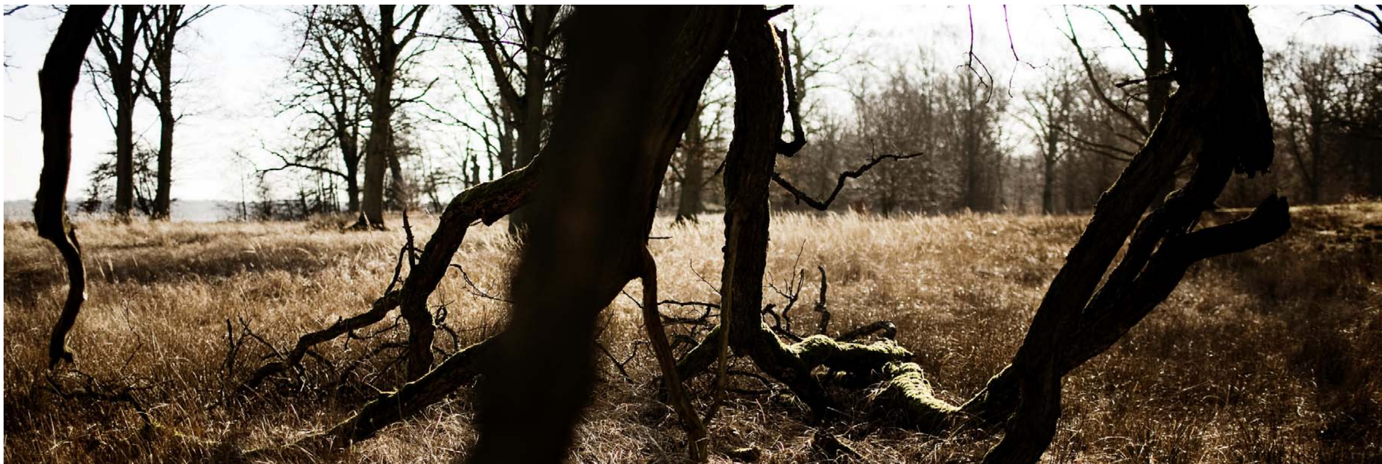
ARTER. Desto større mangfoldighed i plante- og dyrearter, desto større biodiversitet. Man anslår, at der findes ca. 32.000 arter i Danmark. Hovedparten af dem befinder sig i skovene, hvorfor vi bør omlægge løvskov til urørt skov.