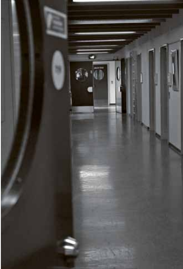
Fig. 5. Udviklingsafdelingen består af fire gange af omtrent samme længde som den på billedet. På højre side ses døre til kontorer.

jo; vi har en kontorarbejdsplads, men vi er faktisk ikke så stillesiddende som de andre [arbejdspladser], der var med i projektet. [...] Så på den måde er vi måske fejlcastet. [Men] vi har jo fået meget andet ud af det, så det ved jeg ikke.”