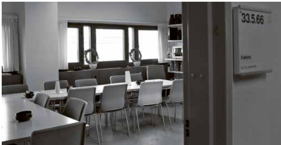
Fig. 4. Køkkenet på udviklingsafdelingen.