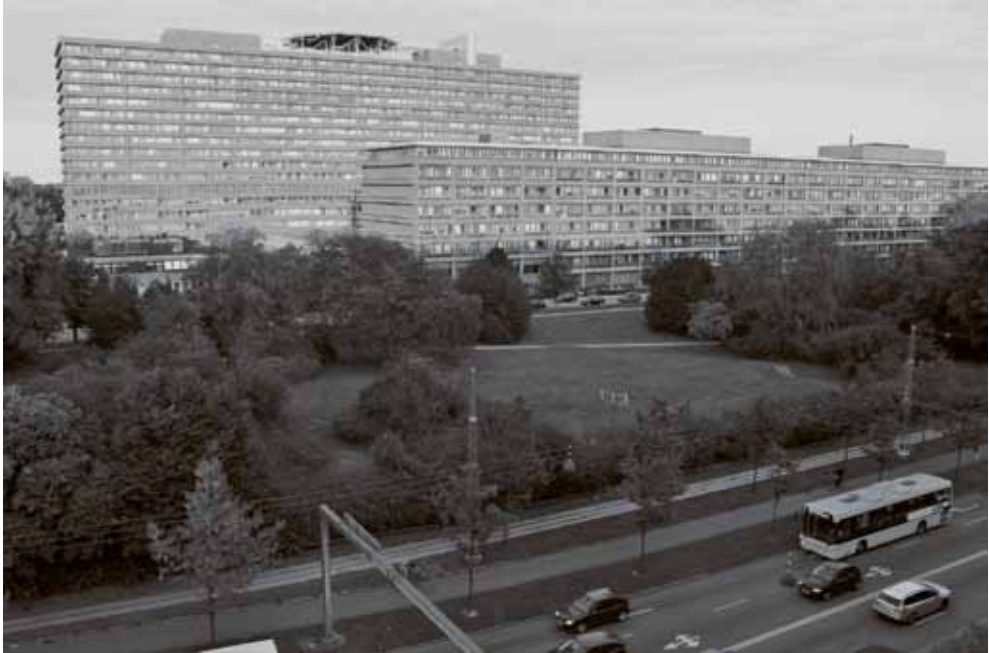
Fig. 8. Rigshospitalet set fra Tagensvej.

siastgruppen også peger i retning af, at mennesker har muligheder og handlerum. Ikke alene omdefinerede medarbejderne projektpakkens aktiviteter, men gruppen udviklede sig også til en kærkommen anledning for flere af medarbejderne til at styrke deres kollegiale relationer. Dette førte til en forbedring af afdelingens sociale krop, forstået helt enkelt som de sociale relationer mellem kolleger. Entusiastgruppen handler dermed om bevægelse – men også om, hvordan man kan vælge en identitet som entusiast, ligesom den handler om kollegialt sammenhold.