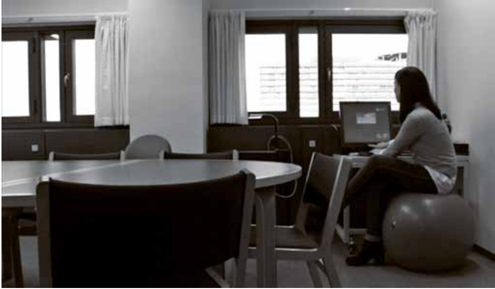
Fig. 3. En person benytter muligheden for at sidde på en pilatesbold frem for en stol i et mødelokale på udviklingsafdelingen.

og positiv omtale for arbejdspladsen. 10