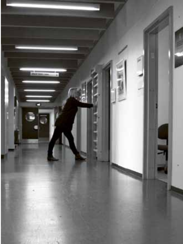
En person strækker ud på gangen på udviklingsafdelingen.

ikke så galt, som det så ud. Men det har da gjort, at jeg har fået fokus på det. Jeg har stadigvæk fokus på [...] den der sammenhæng mellem stress og motion, og hvordan man kan holde stressen nede ved at dyrke motion. Vi er sådan en medarbejdergruppe, som alle sammen har så meget at lave, at vi sagtens kan blive stressede. [...] Vi er udsatte, kan man sige.”