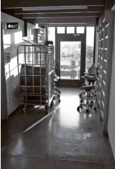
Fig. 7. Yoga-måtterne på billedet er anskaffet i forbindelse med Krop & Kontor.

det ikke uvæsentligt, at mange medarbejdere på Rigshospitalets Udviklingsafdeling i kraft af deres uddannelse og professionelle virke selv har en sundhedsvidenskabelig baggrund med fokus på medicinske og kropsobjektiverende tilgange og i et vist omfang kan antages at tænke med - og ikke imod - krop-sind dualismen. Hanne kunne også berette om medarbejdere, der var blevet pikerede over forskellige udtalelser, fordi – som de sagde – ”det er fysiologisk [...] og anatomisk [...] ukorrekt.”