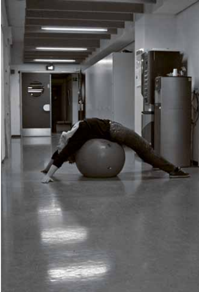
Fig. 9. En person laver pilatesøvelser foran kaffeautomaten på gangen.

bliver bragt i spil på grund af et sundhedsfremmeprojekt af begrænset omfang. Analysen af projekt Krop & Kontor indeholder således flere væsentlige indsigter i forhold til en forståelse af de mangfoldige implikationer af praktisk, social og moralsk karakter, som sundhedsfremmeinitiativer kan have for de mennesker (og kroppe), der gøres til genstand for en projektintervention på deres arbejdsplads.