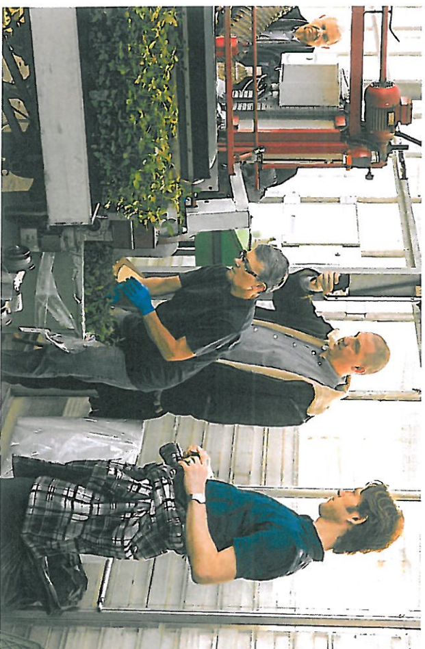
Figur 3. Under UV4growth mødet i Odense var et af holdpunktene ekskursjonen til Rosa Danica, hvor 18 forskere, firmaer og gartner fra otte lande med stor interesse diskuterede alle tekniske praktiske og videnskabelige aspekter af væksthuseproduktion.

om innovativt lys. Der skulle bruges af hele spektret undersøges og systematiseres, med hovedmålet at involvere så mange gartner og firmaer som muligt. I