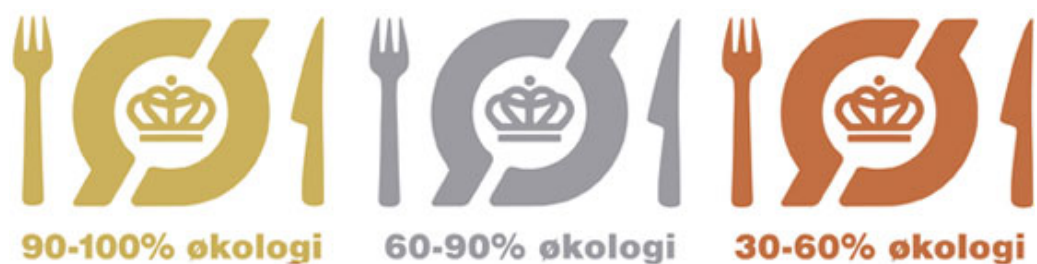
Figur 1. Det økologiske spisemærke

Et redskab i omstillingen af storkøkkenerne til økologi er det såkaldte "økologiske spisemærke". Udformningen af de økologiske spisemærker er illustreret i figur 1.